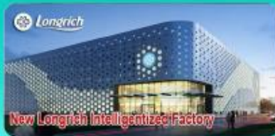
New Longrich Intelligent Factory